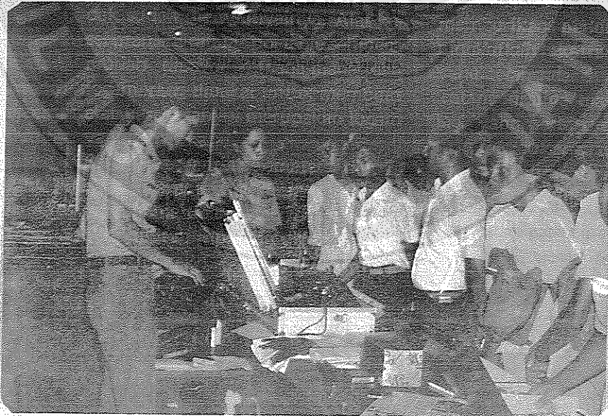
Para petugas pameran sedang memberikan penjelasan pada para pengunjung.