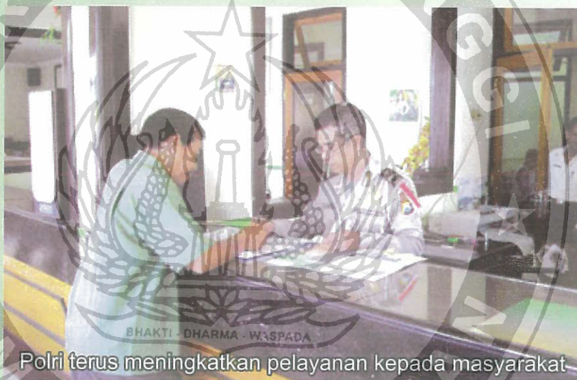
Polri terus meningkatkan pelayanan kepada masyarakat

Membandingkan dengan program reformasi di Departemen Keuangan, tim khusus reformasi dibentuk dan dipimpin langsung oleh Menteri, dengan jajaran yang melibatkan seluruh eselon tertinggi. Rancangan penataan organisasi, penyempurnaan proses tata kerja, manajemen sumber daya manusia, dan rancangan reward and punishment termasuk