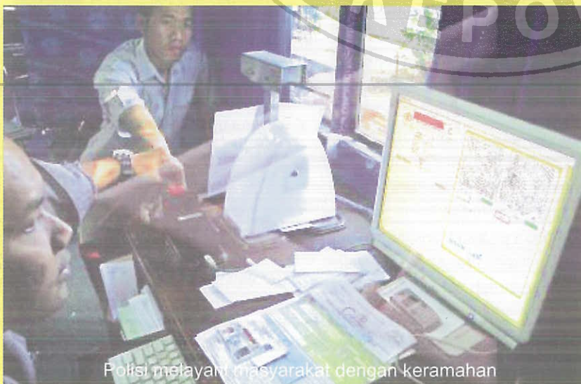
Polisi melayani masyarakat dengan keramahan

Kehendak untuk menjalankan transparansi dan akuntabilitas, serta reformasi birokrasi pada umumnya, masih diwujudkan secara nyata. Cara untuk konkretisasi ialah dengan menyusun program khusus untuk itu. Melaksanakan reformasi benar-benar merupakan sebuah langkah besar. Tidak mungkin rasanya untuk melaksanakan program reformasi hanya dengan pidato dan retorika yang baik disertai dengan "trik" public relation atau image building saja melalui iklan ke masyarakat. Reformasi itu tidak dapat dilakukan secara apa adanya, sebagai kegiatan sampingan dan sekedar menyerahkan kepada unit-unit fungsional yang sudah ada. Polri telah merumuskan