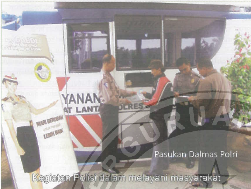
Pasukan Dalmas Polri