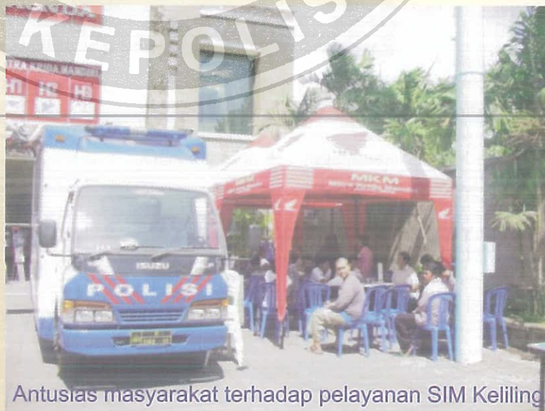
Antusias masyarakat terhadap pelayanan SIM Keliling

Keberhasilan suatu reformasi sangat bergantung pada kepemimpinan leadership dan rasa memiliki ( ownership ) dari jajaran-jajaran utama yang sesuai untuk tugas reformasi itu. Faktor ini vital, dan pemimpin dengan kualitas demikian tidak selalu bisa diperoleh dengan mudah. Dari riwayat gerakan reformasi yang masih pendek, fakta empirik menunjukkan, tanpa pemimpin kuat dalam hal pemimpin tertinggi di masing-masing satuan usaha reformasi tidak bisa berkelanjutan, bahkan mungkin tidak pernah akan bisa dimulai.