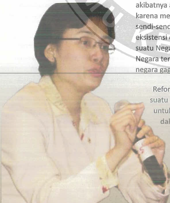
Pih Menko Ekuin Dr. Sri Mulyani Indrawati

Tujuan reformasi tersebut mencakup segalanya. Artinya reformasi birokrasi/institusi harus dimulai dengan pengakuan bahwa kita berangkat dari keadaan aparatur Negara yang masih kotor, belum profesional, dan kurang bertanggungjawab, sehingga menyebabkan birokrasi yang inefisien