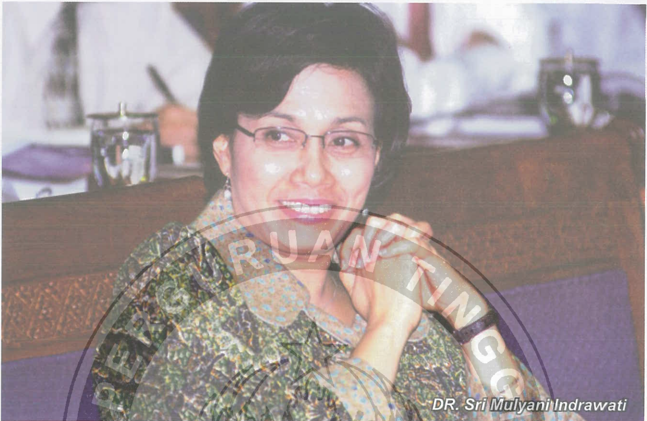
DR. Sri Mulyani Indrawati

tidak mampu mencegahnya dan Polri sebagai bagian integral dari angkatan bersenjata pada masa itu bahkan ikut (atau ikut-ikutan) bersama melakukan penyelewengan itu, tidak terkecuali. Meminjam istilah dalam hukum pidana, maka Polri (walau bukan semua) bisa disangka telah 'turut serta melakukan perbuatan' yang melawan hukum, atau berada diluar jalan hukum pada masa itu.