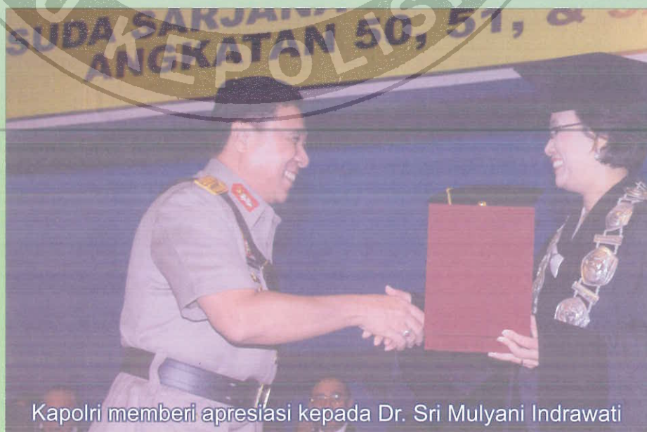
Kapolri memberi apresiasi kepada Dr. Sri Mulyani Indrawati

Semua itu berlangsung tanpa kontrol eksternal yang berarti karena dalam sistem otoriter maka tidak ada kontrol terhadap kekuasaan, apalagi yang datang dari luar. Polri yang berfungsi sebagai penegak hukum